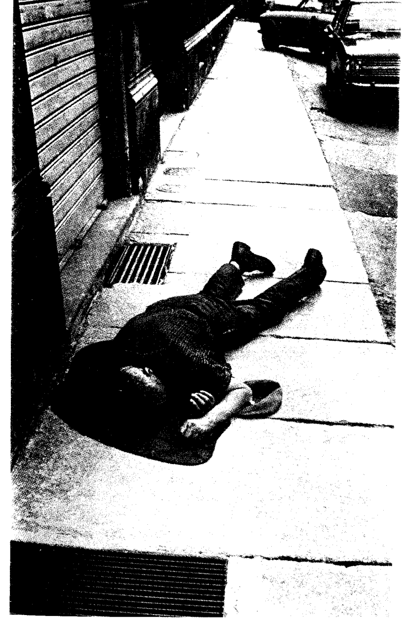
Il Figlio dell'uomo non ha dove posare il capo.