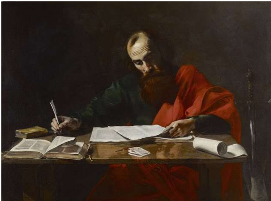
Valentin de Boulogne (1591–1632) San Paolo scrive le sue Lettere, 1618 olio su tela

Orientarsi nell'inaspettato e custodirsi nell'Amore di Dio